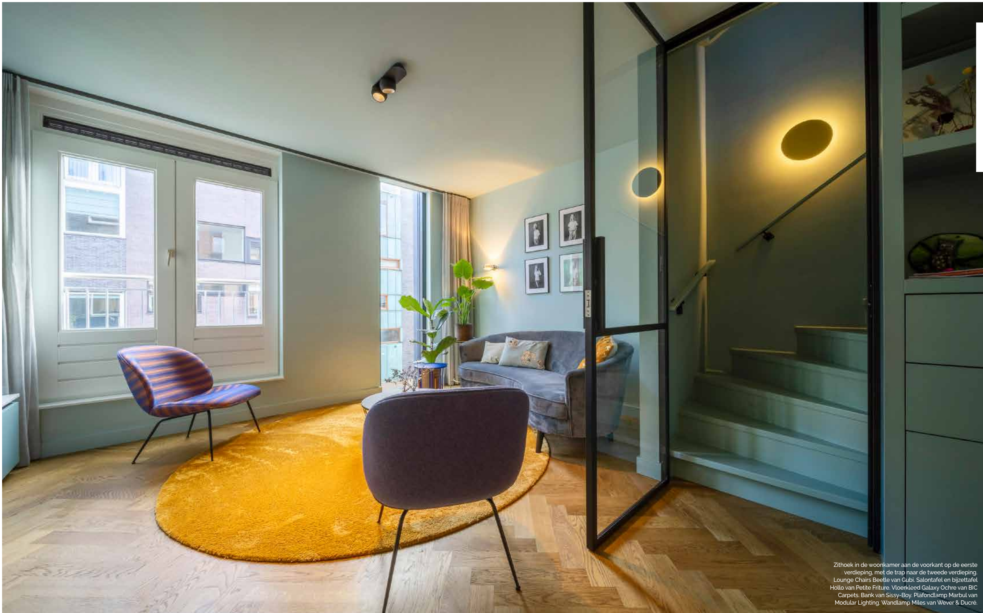
Zithoek in de woonkamer aan de voorkant op de eerste verdieping, met de trap naar de tweede verdieping. Lounge Chairs Beetle van Gubi. Salontafel en bijzettafel Hollo van Petite Friture. Vloerkleed Galaxy Ochre van BIC Carpets. Bank van Sissy-Boy. Plafondlamp Marbul van Modular Lighting. Wandlamp Miles van Wever & Ducre.