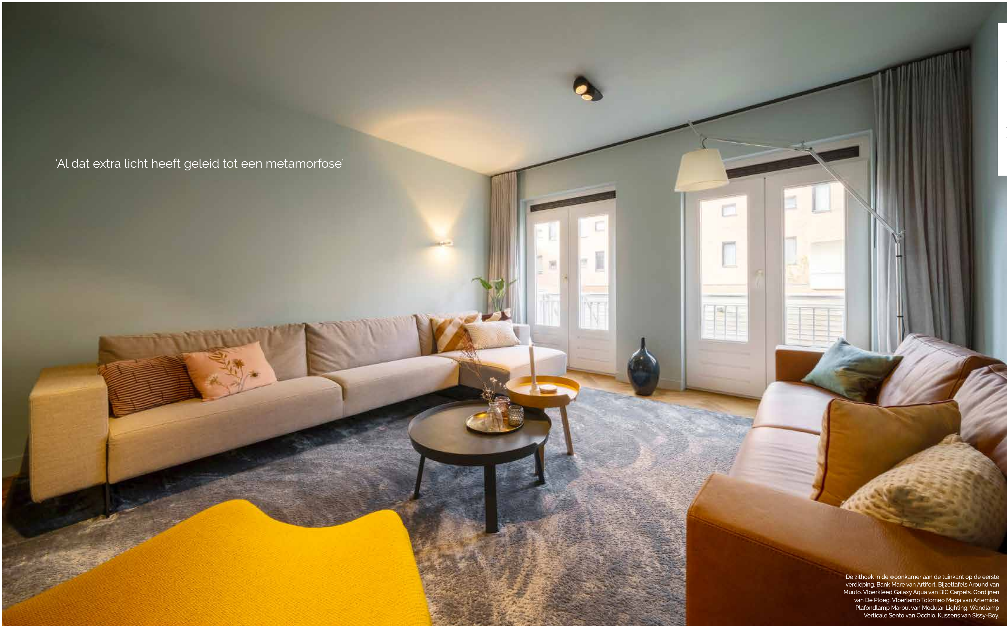
De zithoek in de woonkamer aan de tuinkant op de eerste verdieping. Bank Mare van Artifort. Bijzettafels Around van Muuto. Vloerkleed Galaxy Aqua van BIC Carpets. Gordijnen van De Ploeg. Vloerlamp Tolomeo Mega van Artemide. Plafondlamp Marbul van Modular Lighting. Wandlamp Verticale Sento van Occhio. Kussens van Sissy-Boy.

'Al dat extra licht heeft geleid tot een metamorfose'