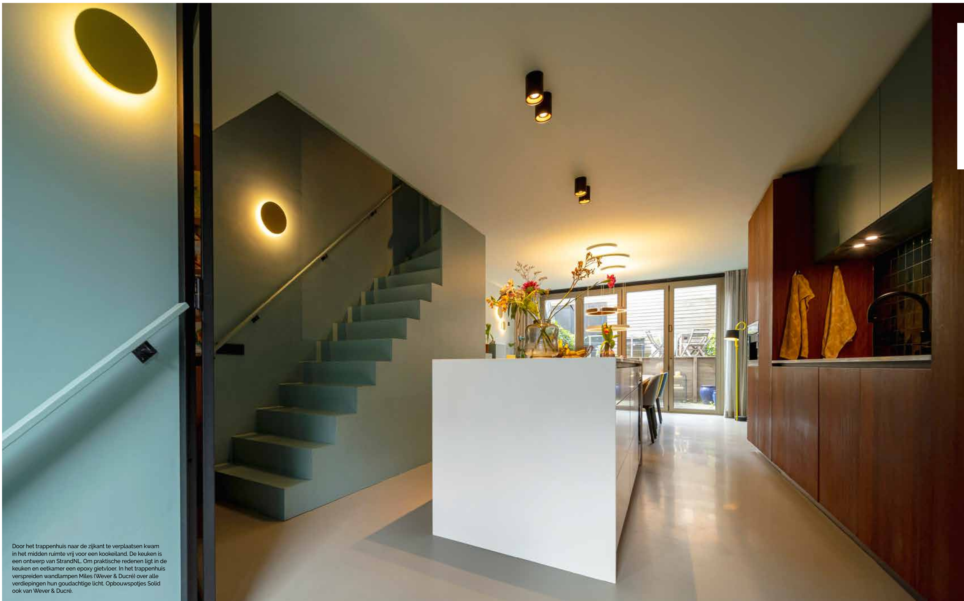
Door het trappenhuis naar de zijkant te verplaatsen kwam in het midden ruimte vrij voor een kookeiland. De keuken is een ontwerp van StrandNL. Om praktische redenen ligt in de keuken en eetkamer een epoxy gietvloer. In het trappenhuis verspreiden wandlampen Miles (Wever & Ducre) over alle verdiepingen hun goudachtige licht. Opbouwspotjes Solid ook van Wever & Ducre.